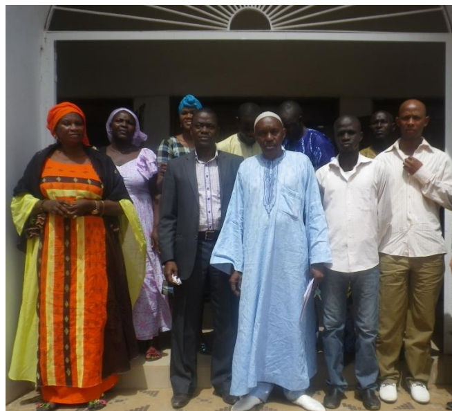
Les acteurs locaux de Sédhiou et les migrants se réunissent pour parler des enjeux de développement qui leur tiennent à cœur.

L'intérêt de travailler avec les migrants dans un double espace, c'est-à-dire d'un territoire à l'autre , est d'apporter une réponse au fait que les acteurs de développement d'ici se sont toujours plaints de ne pas être informés des réalisations