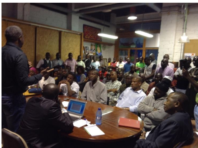
A Montreuil (France) et à Barcelone (Espagne), les rencontres d'échange entre les migrants ont fait salle comble.

Ces deux dispositifs de pilotages sont intrinsèquement liés par des échanges fréquemment organisés par voies électroniques, téléphoniques ou par des missions à Sédhiou ou en France permettant de discuter de quelques aspects particuliers au projet. Le détachement d'un chargé de mission Grdr au sein de l'ARD a également permis de faciliter la collaboration entre les deux structures dans la mise en œuvre des actions du projet, notamment pour les activités de recherche et études